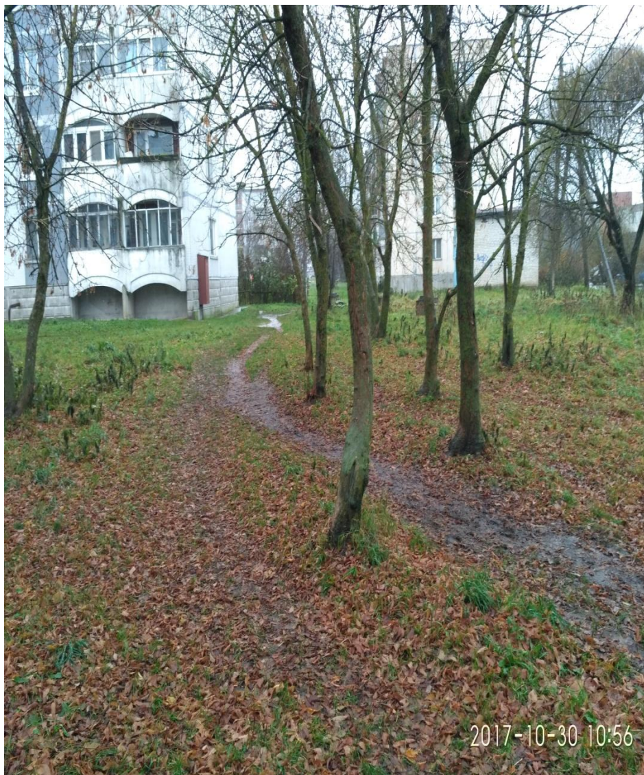
вид от дома №3