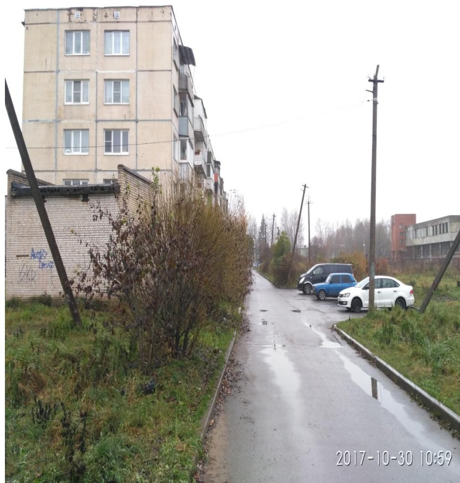
вид на дом со двора