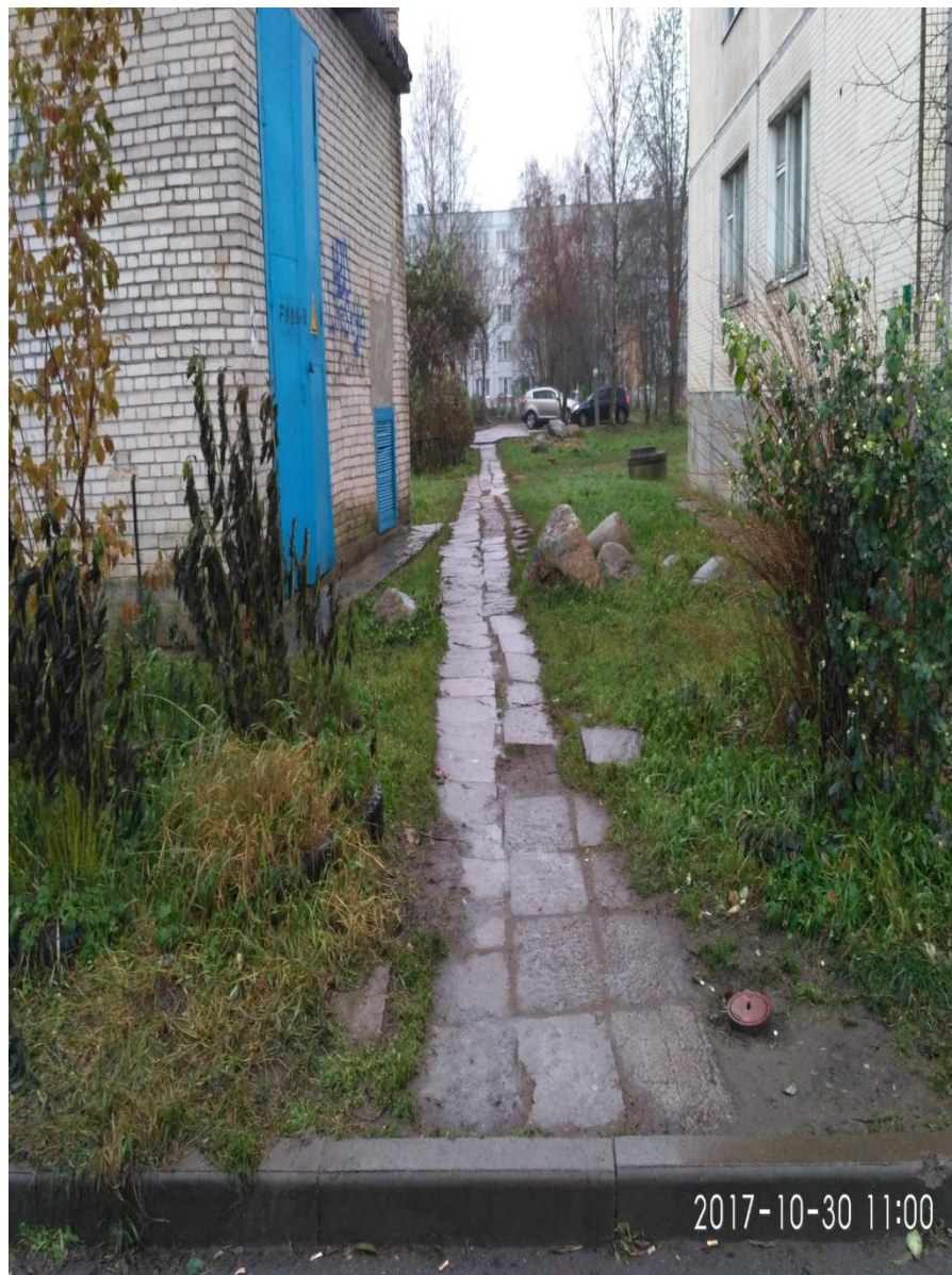
вид на тропу между домом и подстанцией