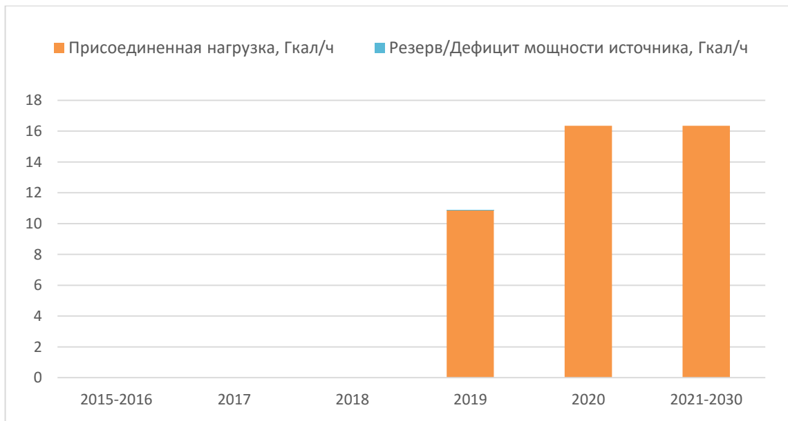
Рисунок 2.4. Балансы тепловой мощности и перспективной тепловой нагрузки котельной №3

Как видно из диаграмм на рисунках 2.2 – 2.4, на период до 2030 года на всех источниках дефицита тепловой мощности не наблюдается.