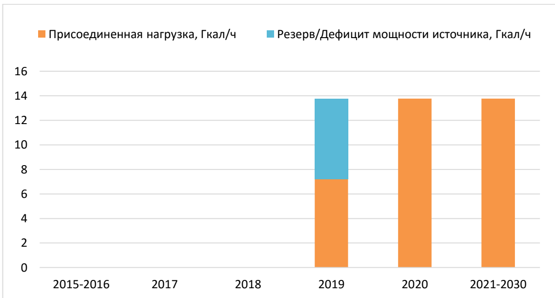
Рисунок 2.3. Балансы тепловой мощности и перспективной тепловой нагрузки котельной №2